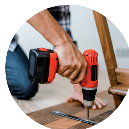
Bricolage et Jardinage