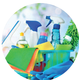
Entretien du cadre de vie

notre vocation ? vous faciliter le quotidien !