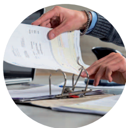
Aide aux démarches administratives