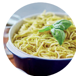
Aide à la préparation des repas, courses