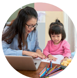
Garde d'enfants de plus de 3 ans