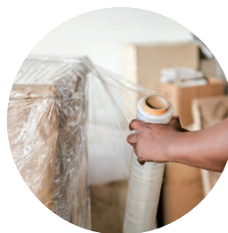
Aide au déménagement